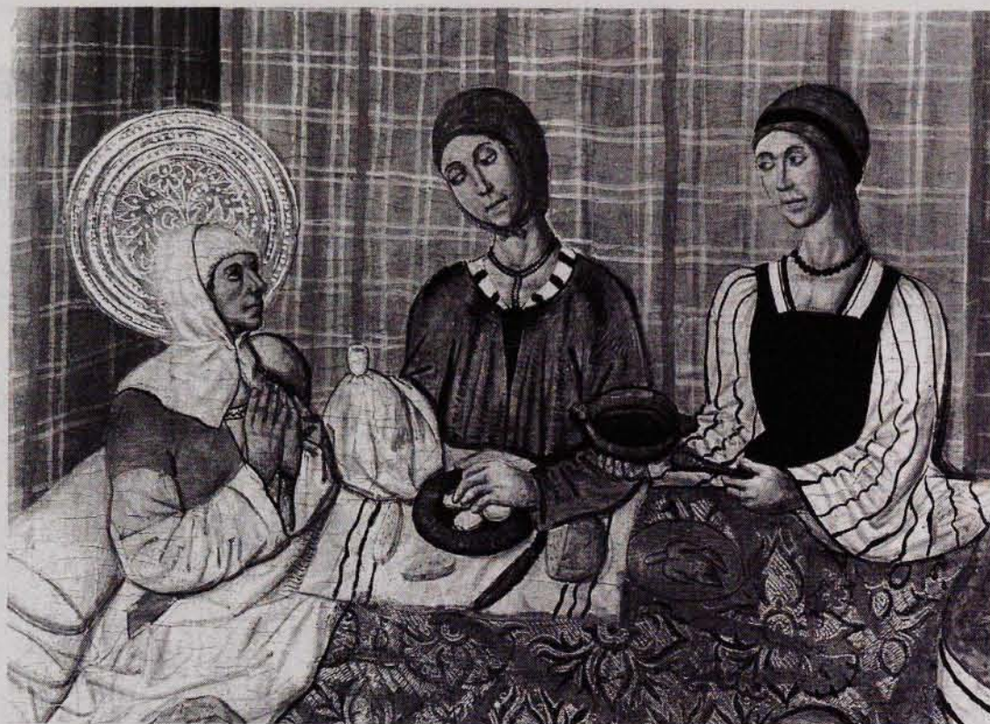
FIG. 7. Naixement de la Verge de PERE GARCIA DE BANAVARRI. Detall. Cap a 1475. Procedeix de l'església parroquial de Montanyana (l'Alta Ribagorça, Osca). MNAC/MAC 114750. Amb permís.