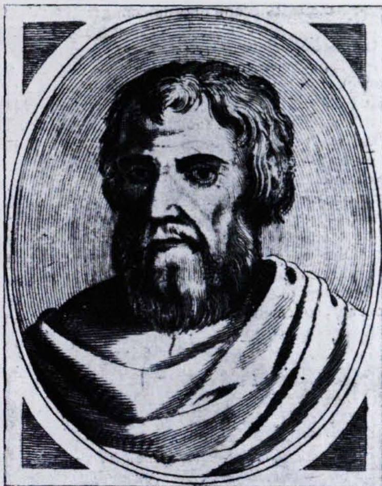
FIG. 3. ARNAU DE VILANOVA.

bé parlà i escriví l'occità. De regrés d'Itàlia, s'instal·là a València, l'any 1276. De seguida, al 1281, es traslladà a Barcelona en qualitat de metge de la Reial Casa, al servei del rei Pere II. Aquí, el dominic Fra Martí, l'inicià en el coneixement de l'àrab (cosa que li permeté traduir al llatí les obres de GALÈ, AVICENA i ALBUZALE). A la mort del rei, continuà essent afavorit per Alfons II i Jaume II.