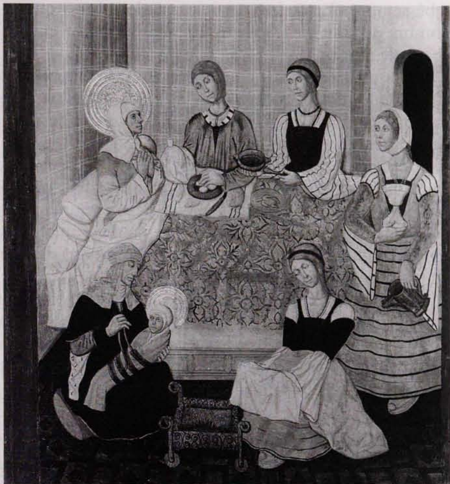
FIG. 8. Naixement de la Verge. Tremp sobre taula, complert. MNAC/MAC 114750. Amb permís.

Segons ens expliquen algunes cròniques, entre els sarraïns existien metgesses que deuriem dedicar-se especialment a la Ginecologia i no a l'Obstetrícia. Existeix una carta a l'Arxiu de la Corona d'Aragó (r. 2. 247, f, 88) escrita al 1404, que així ho testimonia: