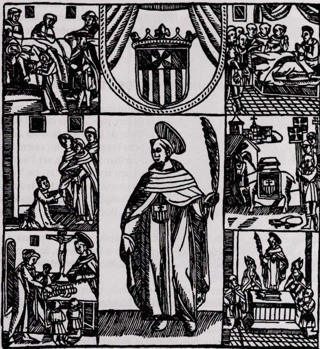
FIG. 2. Estampa sis-centista de Sant Ramon Notat en forma de retaule (Col. de J. Amades).

«Per lo costat», perquè sembla ser que les cesàries fins i tot les «postmortem», es practicaren durant segles realitzant una incisió lateral a l'abdómen i no a la línia mitja.*