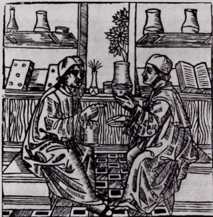
FIG. 5. Metges de roba llarga discutint sobre l'orina d'una embarassada (Compendio de la salud humana, 1495).