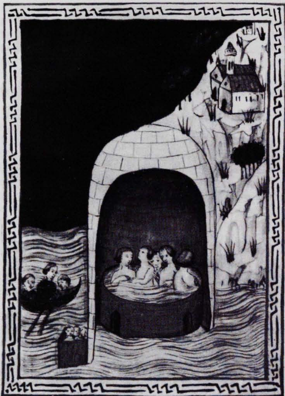
FIG. 4. Dones banyant-se com a tractament mèdic. De l'obra Tratado de Balnearios d'ARNAU DE VILANOVA.

nifaci VIII que, agraït pels seus serveis com a metge (el curà d'uns còlics renals), l'obligà a abjurar en privat, però públicament declarà exagerada la condemna parisenca. En reconeixença, ARNAU li dedicà el tractat màgic De sigillus . D'aquest tema són alguns escrits seus d'alquímia.